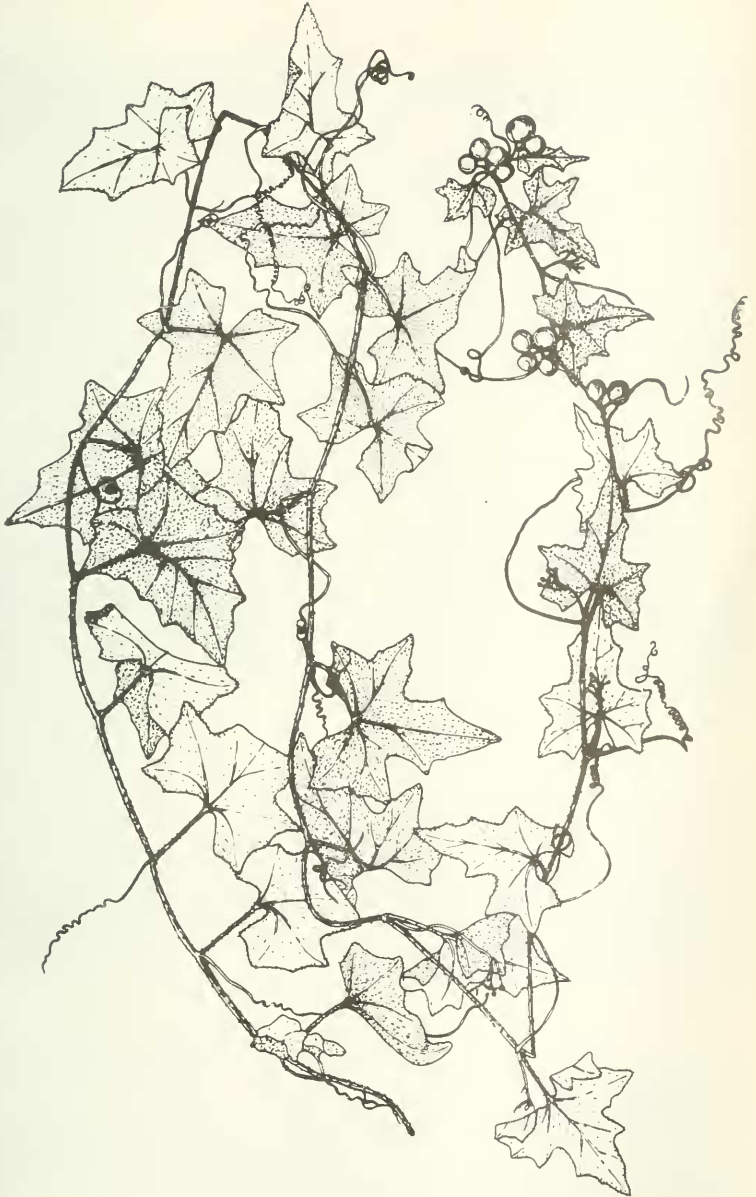
Abb. 2: Bryonia afghanica Podlech (PODLECH 12286) ca. 1/3 nat. Größe